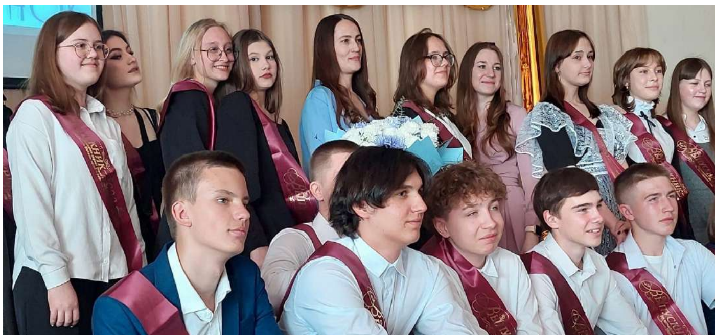
«Последний звонок» для 9 «А», 2023