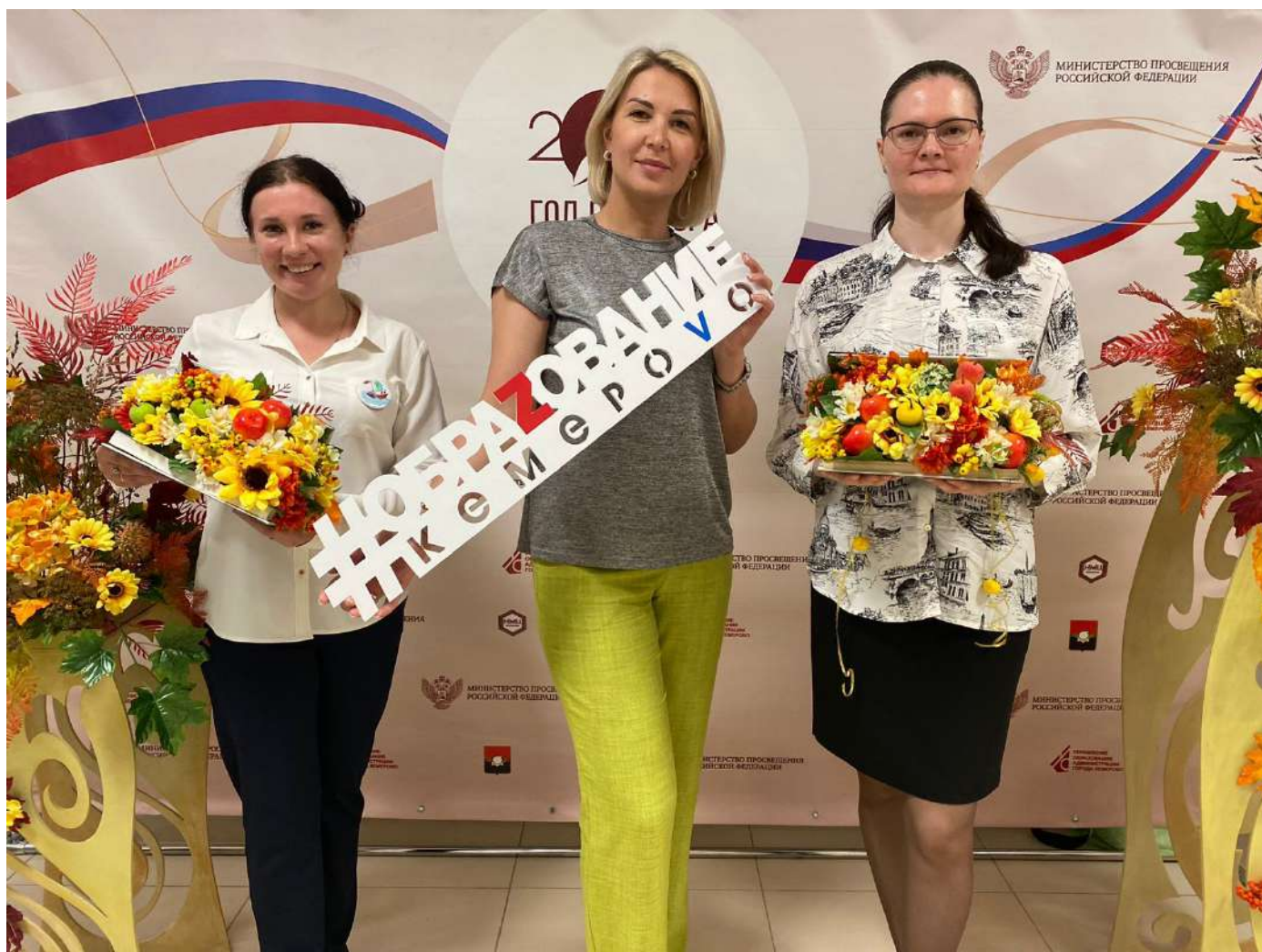
Муниципальный образовательный форум «Современное будущее: проектирование образовательных результатов», 25.08.2023