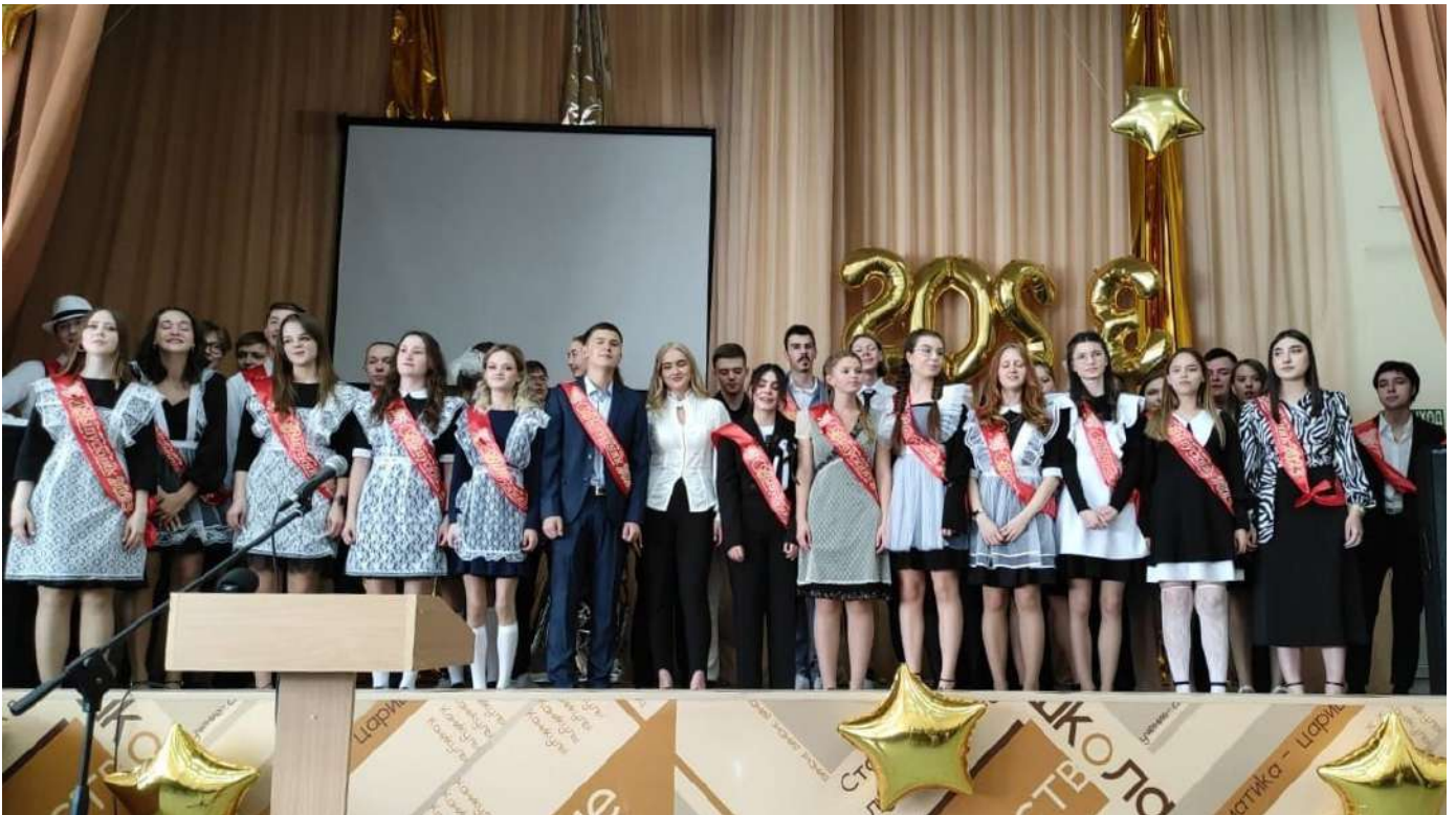
«Последний звонок» 2023 года